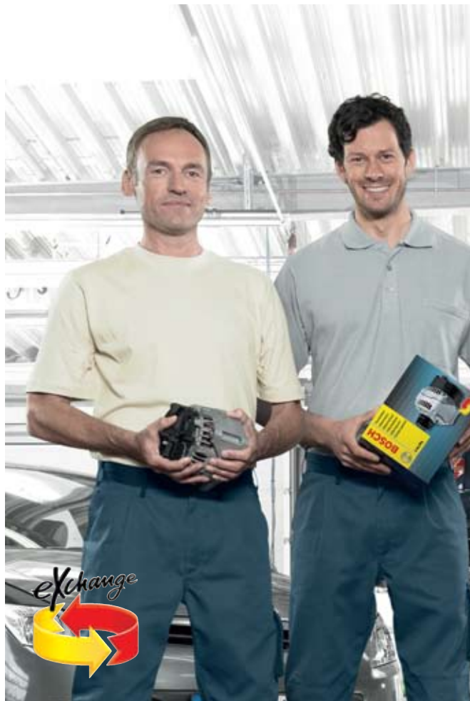
Цялата програма за навременен и ефективен ремонт