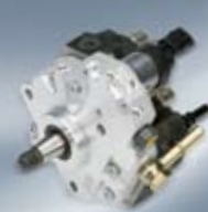
Common Rail помпа с високо налягане