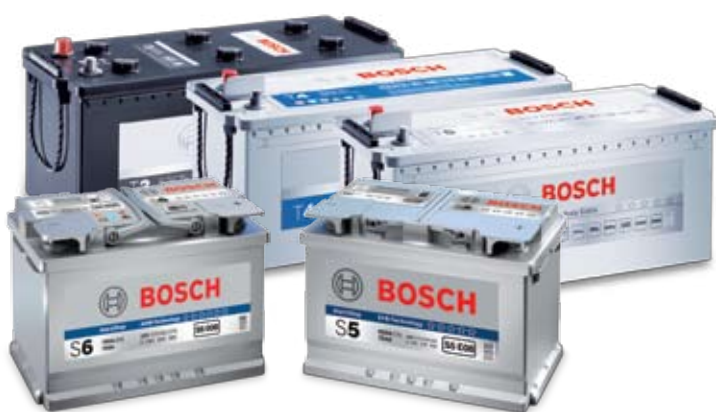
Акумулатори Bosch: повече мощност, сигурност и комфорт

* в сравнение с традиционните стартерни акумулатори