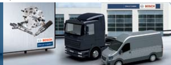
Бош Дизел Център