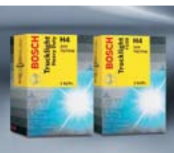
Крушки с нажежаема жичка 24 V