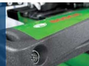
Диагностика на ходовата част FWA