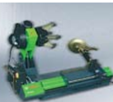
Оборудване за монтаж на гуми TCE

Нашите знания, Вашият успех: Бош предлага на своите сервизи системни знания, техническа информация, уреди за тестване, техническа консултация и резервни части с качество на първоначално вграждане.