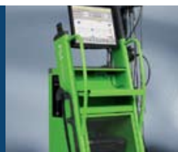
Диагностика на автомобилни системи FSA

Диагностиката на автомобилни системи се прилага, когато системно трябва да се контролират, изпитват или измерват компоненти, системи или конструктивни елементи в монтирано състояние.