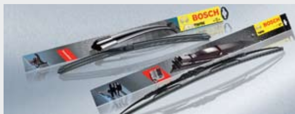
Bosch Aerotwin/Bosch Twin