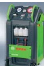
Обслужване на климатични инсталации ACS