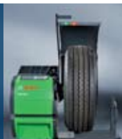
Машина за балансиране на колела WBE