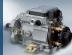
Разпределителна горивонагнетателна помпа