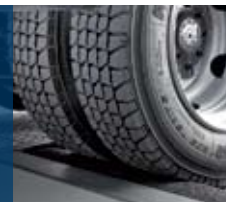
Диагностика на спирачната система BSA