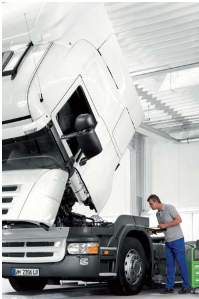
Цялостна система за камиони и автобуси

Стендовете за изпитване на компонентите на дизеловите системи не оставят неизпълнени желания. Могат да се обслужват и ремонтират дори много модерни дизелови системи и компоненти.