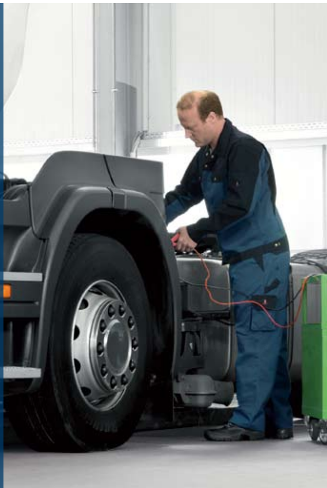
Надеждно електрозахранване за всички

Акумулатори за товарни автомобили, автобуси и транспортери