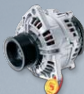
Генератор за товарен автомобил