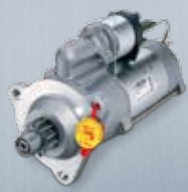
Стартер за товарен автомобил