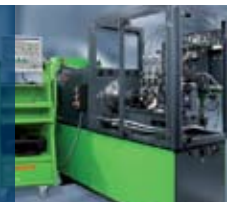
Изпитване на компонентите на дизеловите системи EPS