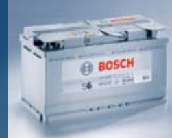
Акумулатор S6 AGM