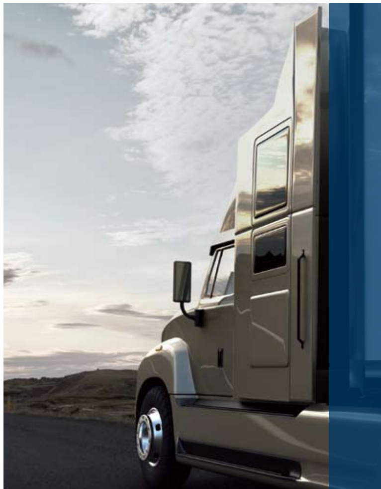
Повече сигурност за товарни автомобили и транспортери

Като първи производител в света, Бош предлага наред с Twin и иновационната техника Aerotwin като комплексна програма за дооборудване на товарни автомобили.