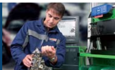
Ремонт на дизелови системи