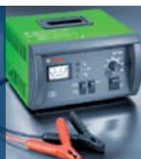
Обслужване на акумулатори ВАТ